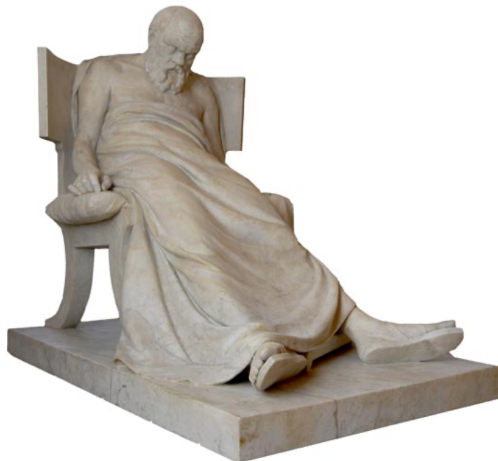
Markus Antokolski, Dying Socrates . Parco Ciani, Lugano city, Switzerland

Plataforma de ensino remoto: Google Classroom